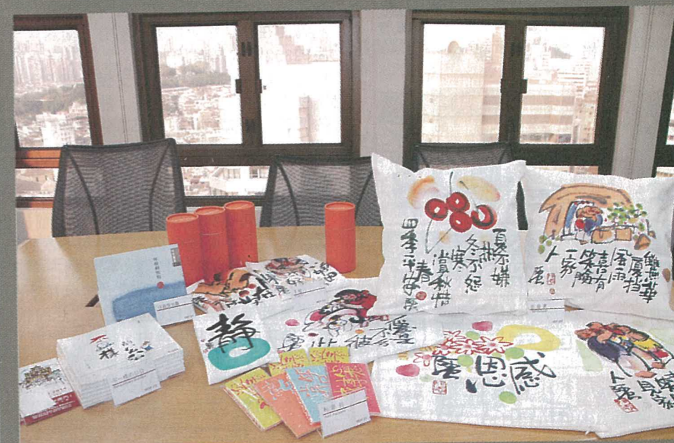
「虫畫虫話#澳門」發售阿虫作品及精品。